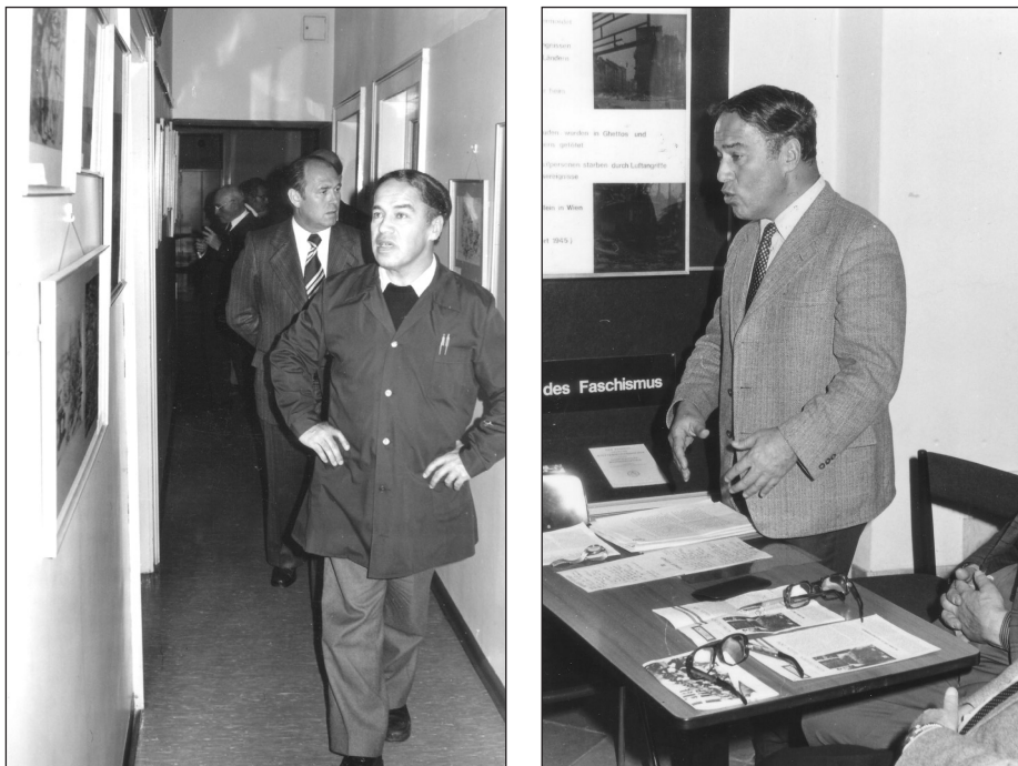
Oben links: Herbert Steiner führt den Kärntner Landeshauptmann Leopold Wagner 1977 durch das DÖW

zweiten Hälfte der 1960er Jahre in der im Europa-Verlag erschienenen Reihe „Monographien zur Zeitgeschichte“ Pionierarbeit mit ersten Veröffentlichungen zur Geschichte der Judenverfolgung 1938–1945, zur Verfolgung der Roma und Sinti und selbstverständlich zur Widerstandsforschung. 34 Bald wurde mit Ausstellungen, Tagungen und Vorträgen, besonders in Schulen, versucht, zur zeitgeschichtlichen Aufklärung und politischen Bildung beizutragen.