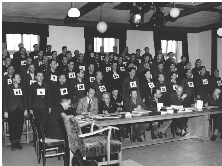
Gruppenfoto der 61 Angeklagten des Dachauer Mauthausen-Hauptprozesses (29. März bis 13. Mai 1946). Im Vordergrund sitzend sind die Verteidiger zu sehen, die ihnen von der US-Armee zur Verfügung gestellt wurden.

auf verschiedenen Ebenen und in verschiedenen Graden der Beteiligung in die Verbrechen zu involvieren. Die Verantwortung wurde nach 1945 einigen wenigen Spitzenfunktionären des NS-Regimes, Hitler, Himmler, Goebbels oder Göring, zugeschoben. Die Vielschichtigkeit der Involvierung erklärt die Hartnäckigkeit der Leugnung nicht nur der Verantwortung, sondern in breiten Kreisen der österreichischen wie auch der deutschen Bevölkerung selbst des Wissens um die Massenmorde und die Verbrechen des NS-Regi-